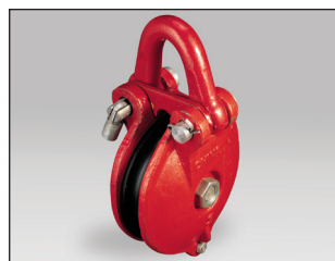
Väkipyörä. Tilausno: 63490