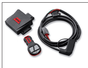
Langaton kauko-ohjain sarja. Tilausno: 76080