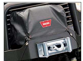
Vinssihuppu. Tilausno: 15639