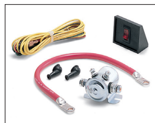
Päävirta solenoidi sarja. Tilausno 12V: 62132 Tilausno 24V: 62880