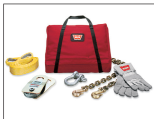
Truck & Suv varustesarja. Tilausnro: 37880