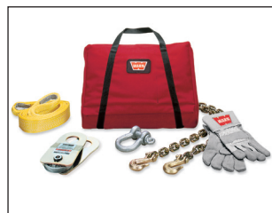
Truck & Suv varustesarja. Tilausno: 37880