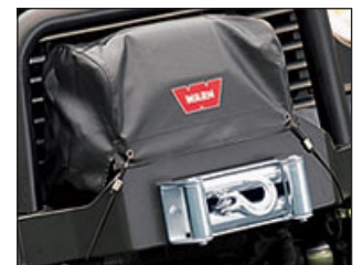
Vinssihuppu. Tilausno: 13918