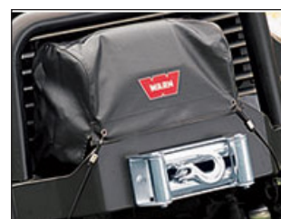
Vinssihuppu. Tilausno: 15639